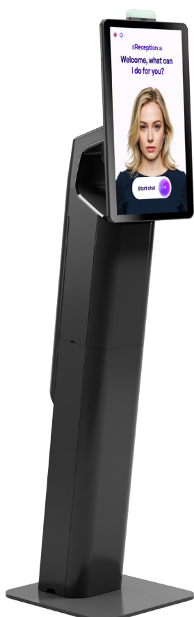
Možnost nastavení vlastního avatara